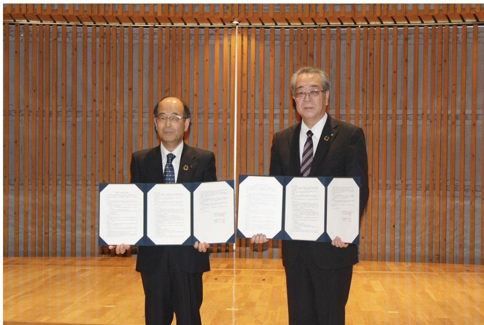
【2023年3月22日 栃木県産業振興センターと連携協定締結】

今後におきましても、地方公共団体等との連携を強化し地方創生に取り組んで参ります。