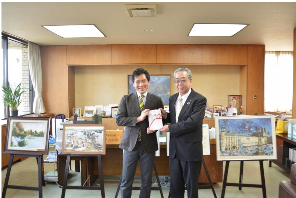
【2023年3月9日 那須塩原市へピーターパンカード寄付金贈呈】

今後におきましても、当信用組合におけるSDGsの取り組みや、地域の中小規模事業者のSDGs取組支援を通して、地方創生に取り組んで参ります。