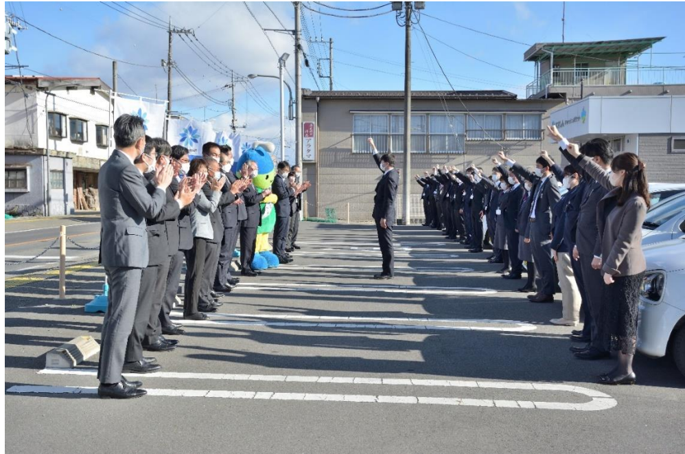
【2023年2月21日 黒磯支店で実施した特別貸出FS】