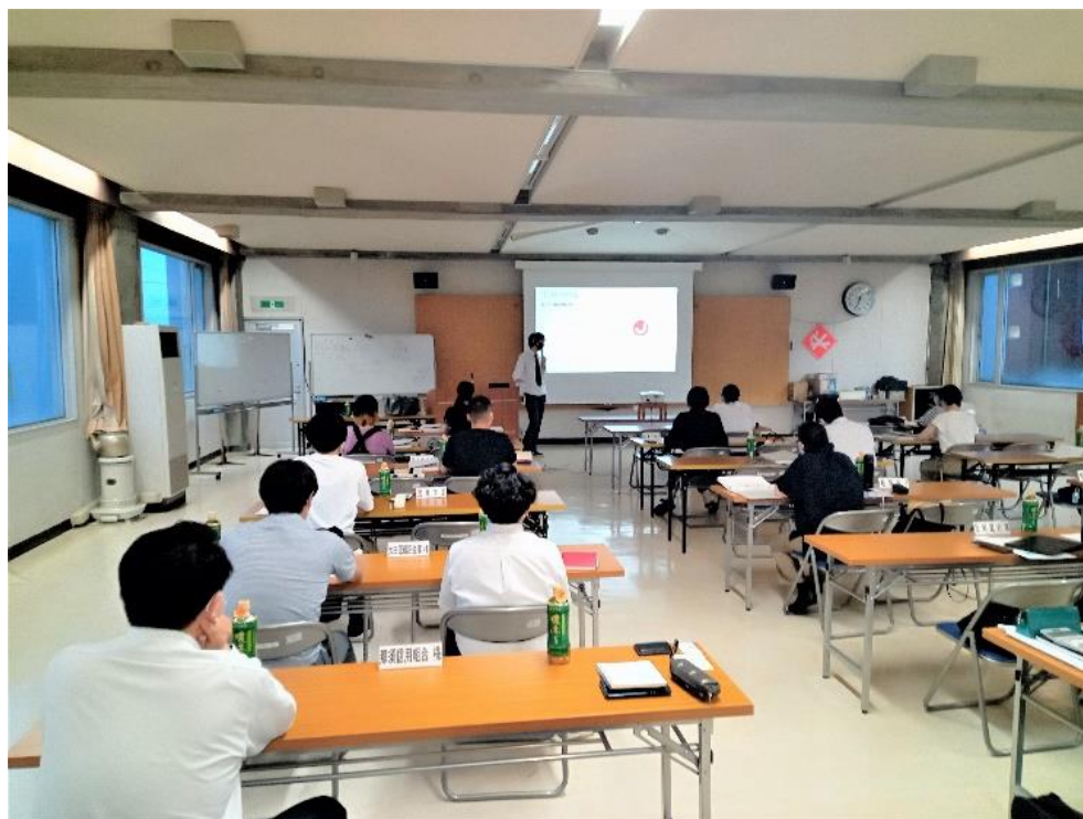
【2022年7月14日 那須塩原市商工会主催 創業支援塾】

今後におきましても、こうした取り組みを継続し、創業や新事業開拓支援による地域経済の活性化並びに地方創生に貢献して参ります。