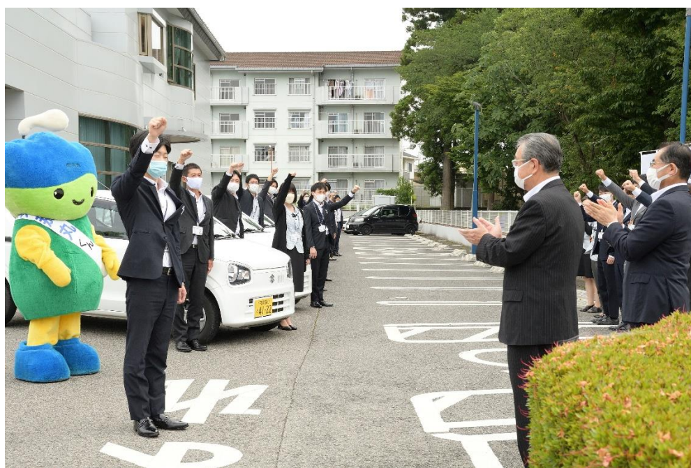
【2022年6月16日 黒磯西支店で実施した特別貸出F S】