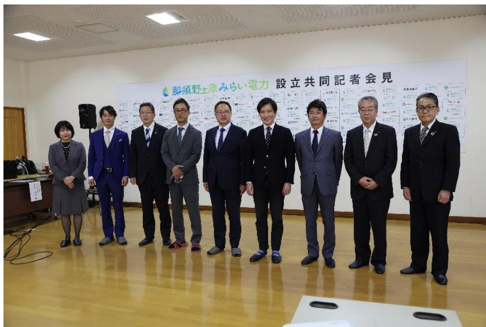
【2022年4月27日「那須野ヶ原みらい電力株式会社」設立記者会見】

今後におきましても、地方公共団体等との連携を強化し地方創生に取り組んで参ります。