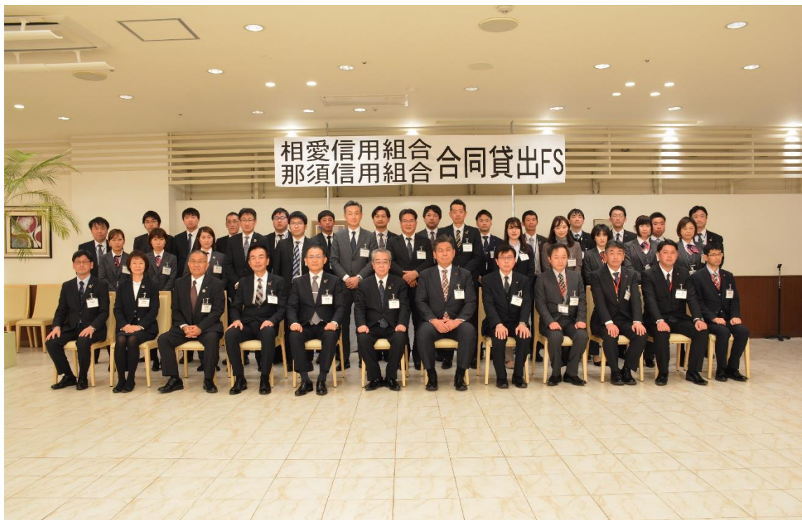
ご視察の皆様との記念撮影