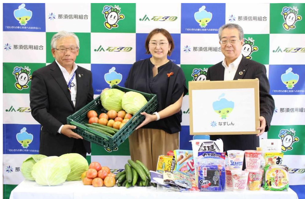
【2021年8月6日 那須信用組合と那須野農業協同組合との連携による「子供食堂応援プロジェクト」始動】

今後におきましても、当信用組合におけるSDGsの取り組みや、地域の中小規模事業者のSDGs取組支援を通して、地方創生に取り組んで参ります。