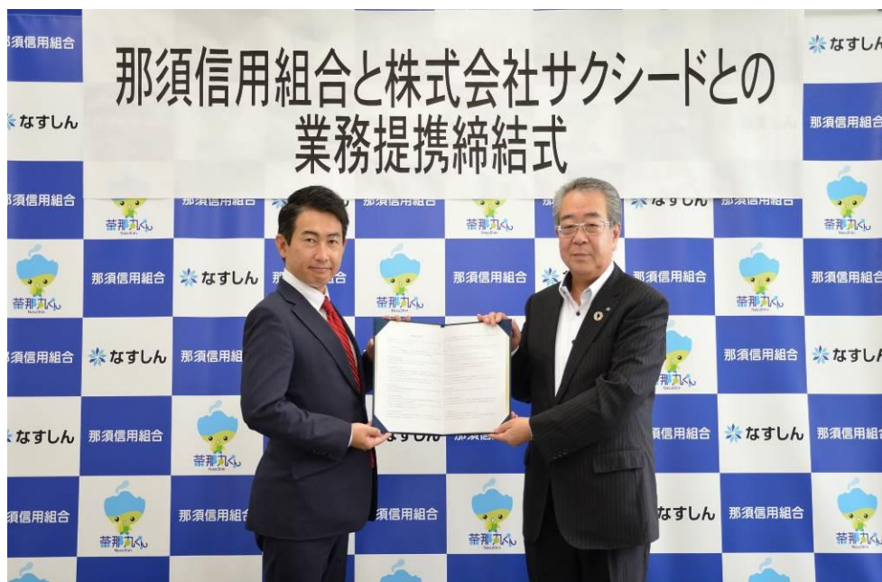
【2021年7月29日 那須信用組合と株式会社サクシードとの業務提携締結式】