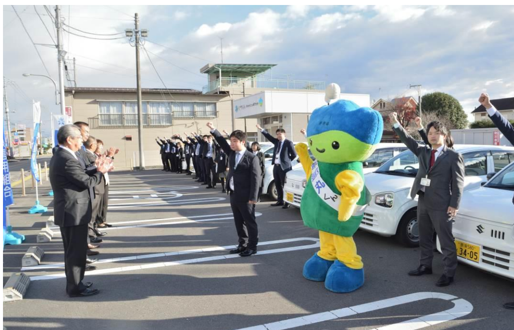
【2021年11月26日 黒磯支店で実施した特別貸出FS】