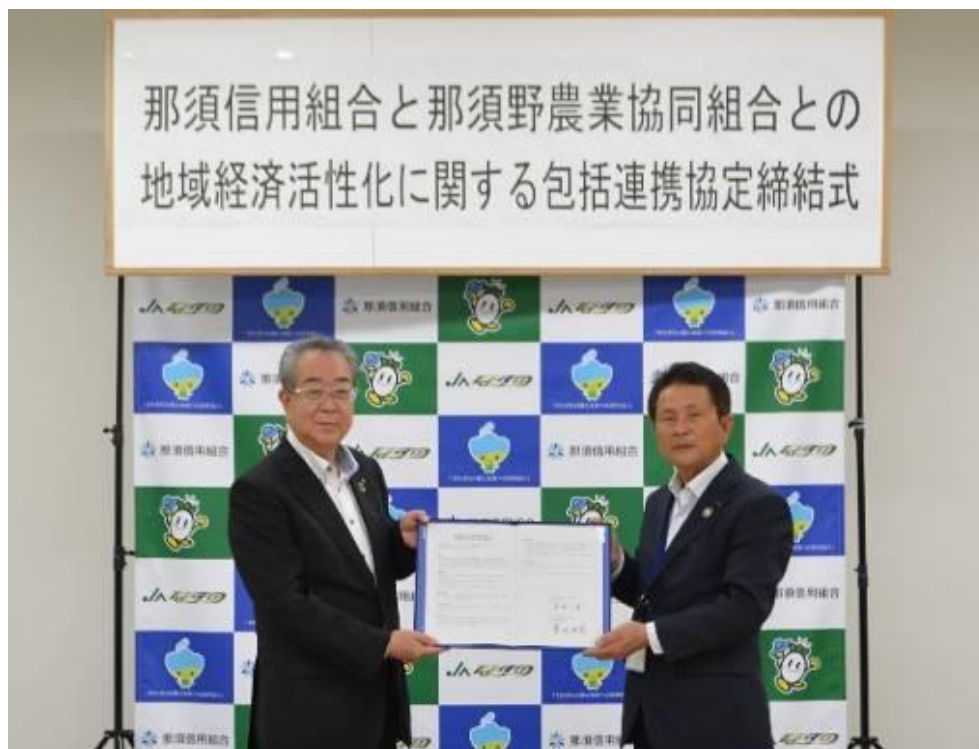
【2021年5月19日 那須信用組合と那須野農業協同組合との 地域経済活性化に関する包括連携協定締結式】

今後におきましても、地方公共団体等との連携を強化し地方創生に取り組んで参ります。