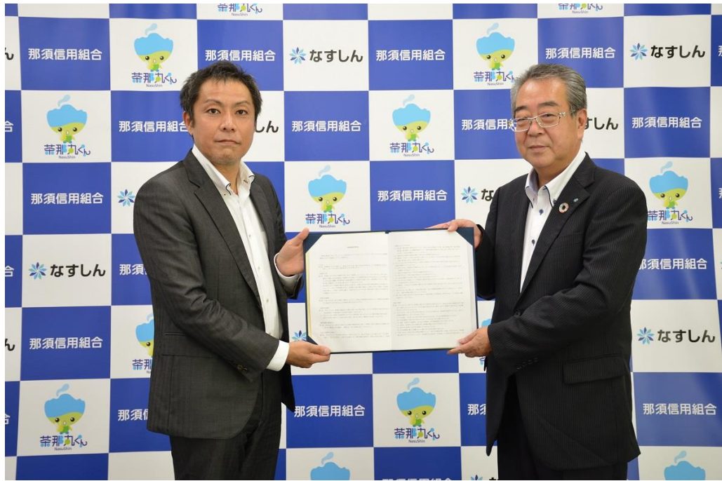
【2020年8月26日 (株)マイナビと業務提携】