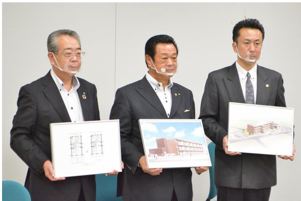
【2020年9月11日 PFI方式による地域優良賃貸住宅の整備事業へ参加（那須町包括連携協定関連事業）】