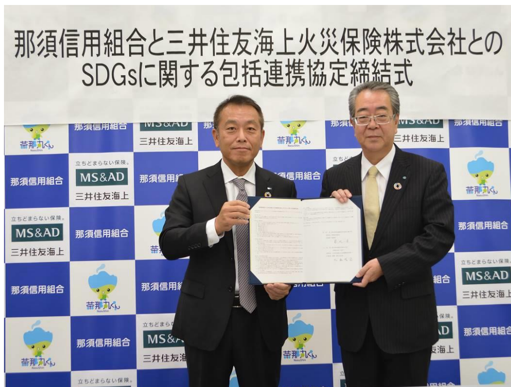
【2019年10月16日 那須信用組合と三井住友海上火災保険株式会社とのSDGsに関する包括連携協定締結式】