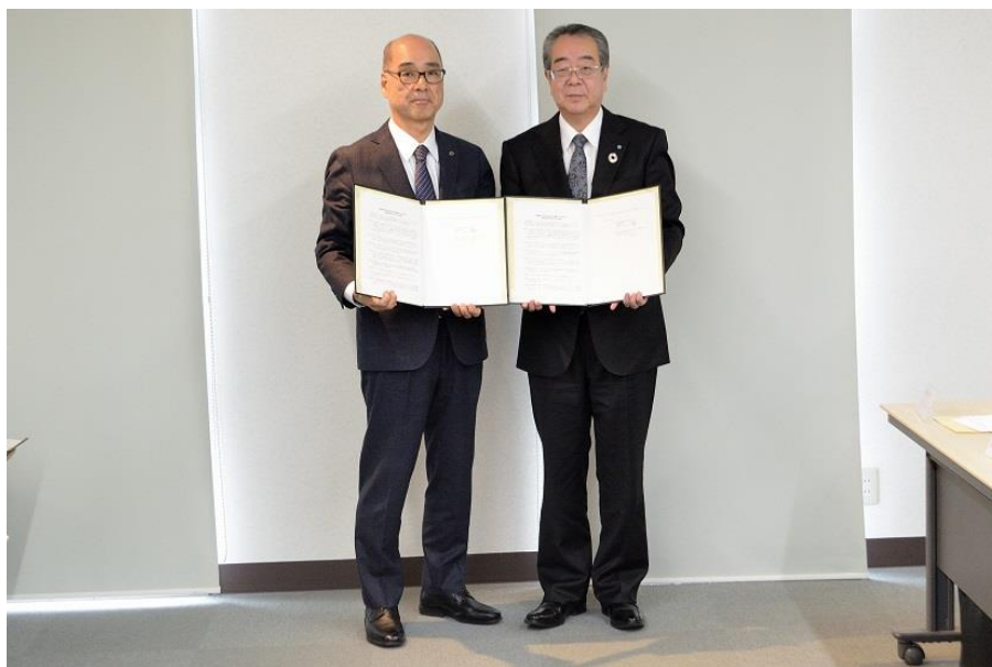
【2020年1月23日 「金融機関と認定経営革新等支援機関である 会員との連携推進制度の利用に係る覚書」締結】