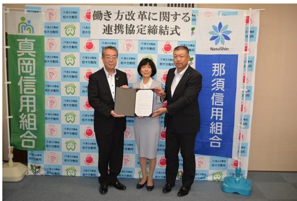
【2019年9月26日 栃木労働局との「働き方改革に関する連携協定」締結】