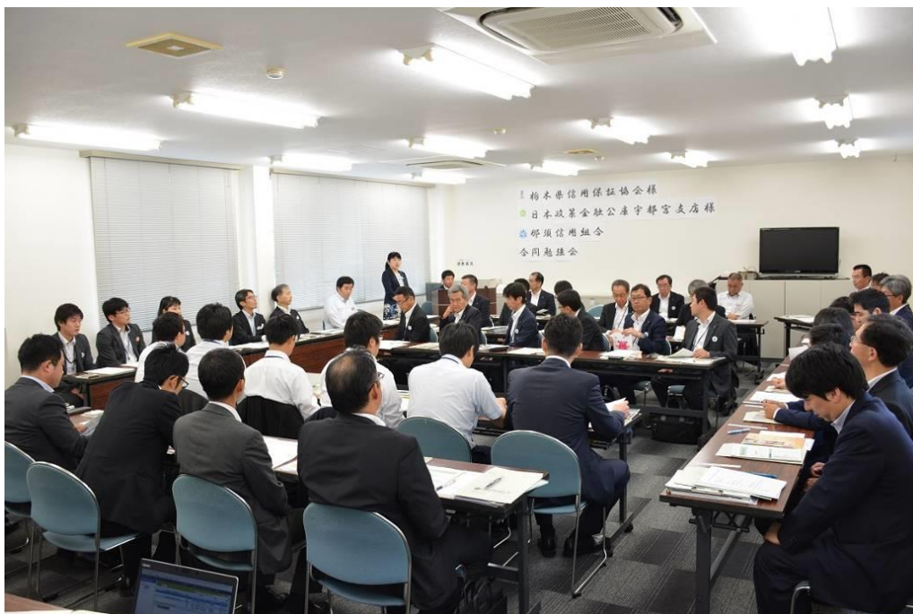
【2019年7月8日 日本政策金融公庫と栃木県信用保証協会との合同勉強会開催】

更に、中小企業の新たな事業活動の促進に関する法律に基づく経営革新等支援機関として、取引先企業の各種補助金採択の支援を行なうことや栃木県信用保証協会の「経営安定化支援事業」を積極的に取り組むことで経営改善支援を行なっております。その他、民間のコンサルタント会社と提携を結び創業支援等の強化を図っております。