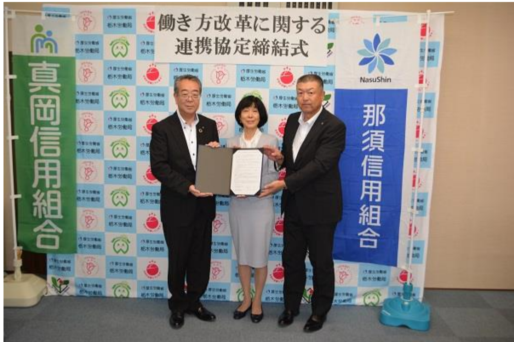
【2019年9月26日 栃木労働局との「働き方改革に関する連携協定締結」】