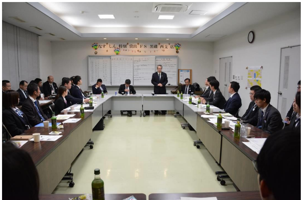
【2019年11月20日 黒磯西支店で実施した特別貸出FS】

また、同チームの主たる業務は、新規開拓および既存取引先を中心とした中小零細事業者への円滑な信用供与ですが、「事業再生・地域活性化支援チームなすしん」との連携や塩沢信用組合より学んだ「特別貸出FS（フィールド・セールス）」活動を実施することにより、地域の中小零細事業者への円滑な信用供与、再生支援、経営支援にも積極的に取り組んでおります。同チームの取り組み状況については、進捗管理委員会において、PDCAサイクルの考え方を基本に諸施策の進捗状況を月次で管理し、必要に応じ営業推進部担当役員が改善を指示し、継続して実効性を高めるよう管理して参ります。