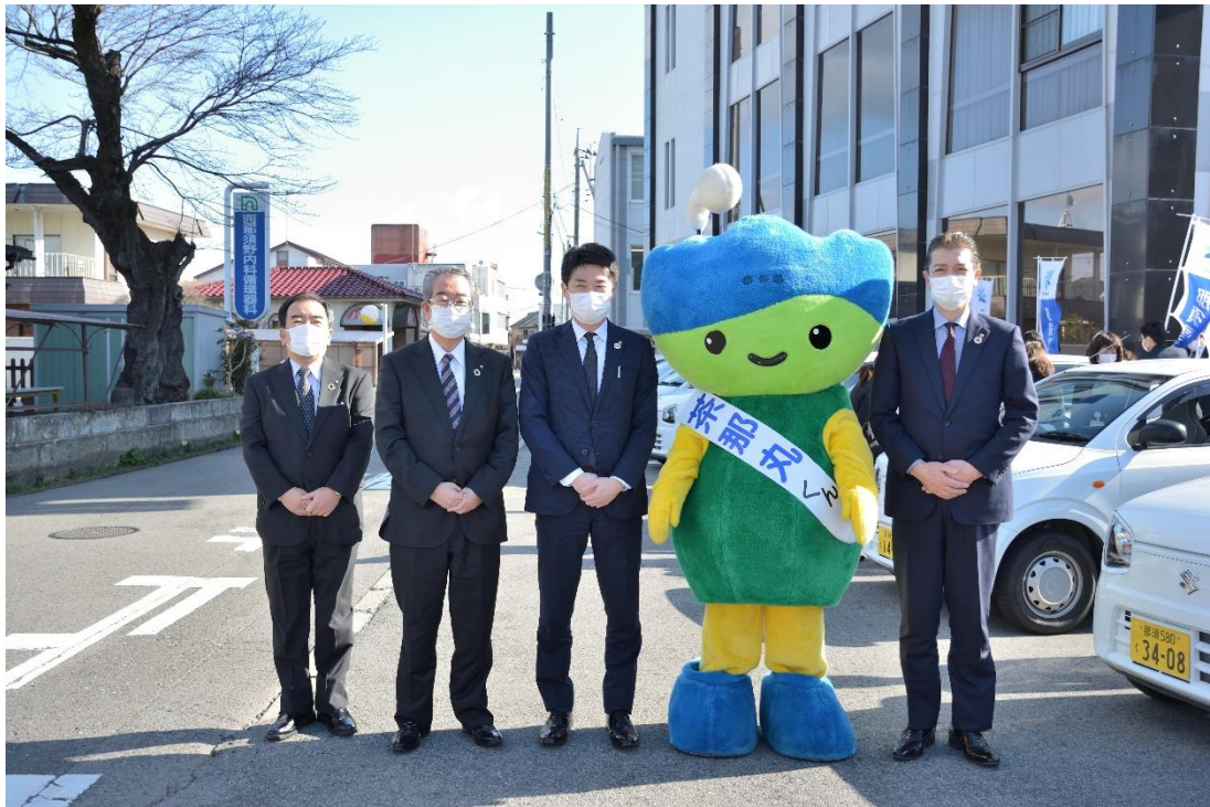
朝 9 時の出発式の様子 No.2