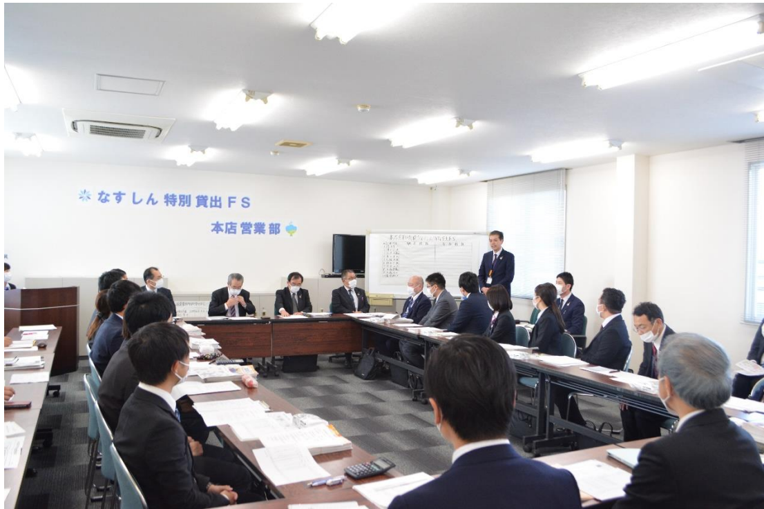
会議の様子 - おわり -