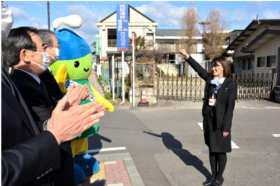
朝 9 時の出発式の様子 No.3