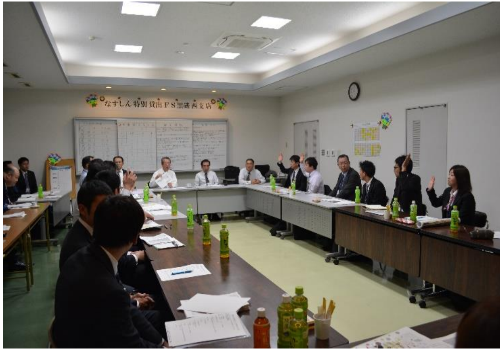
【2018 年 11 月 15 日 黒磯西支店で実施した特別貸出 F S】

化支援チームなすしん」との連携や塩沢信用組合より学んだ「特別貸出 F S」活動を実施することにより、地域の中小零細事業者への円滑な信用供与、再生支援、経営支援にも積極的に取り組んでおります。同チームの取り組み状況については、進捗管理委員会において、PDCA サイクルの考え方を基本に諸施策の進捗状況を月次で管理し、必要に応じ営業推進部担当役員が改善を指示し、継続して実効性を高めるよう管理して参ります。