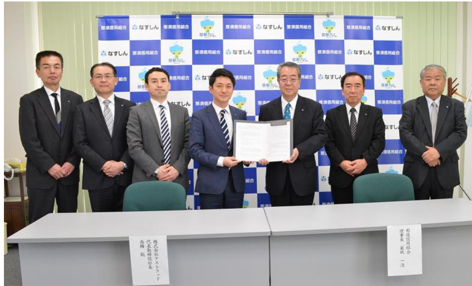
【2018年3月27日 ㈱アストラッドと業務提携】

今後、事業承継問題は更に出てくると考えられるため、支援の重要性は増してくることから、事業者の不安を吸い上げ悩み解消の相談・支援を強化して参ります。