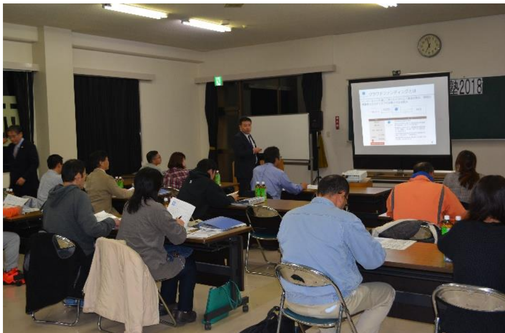
【2018年11月14日 「西那須野創業塾」に講師として参加】

今後も、組合員の皆様と当信用組合の継続的な関わりの場、創業又は新事業の開拓の場として、地域・組合員・そして当信用組合が共に成長・発展していくという「好循環」の実現に向け取り組んで参ります。