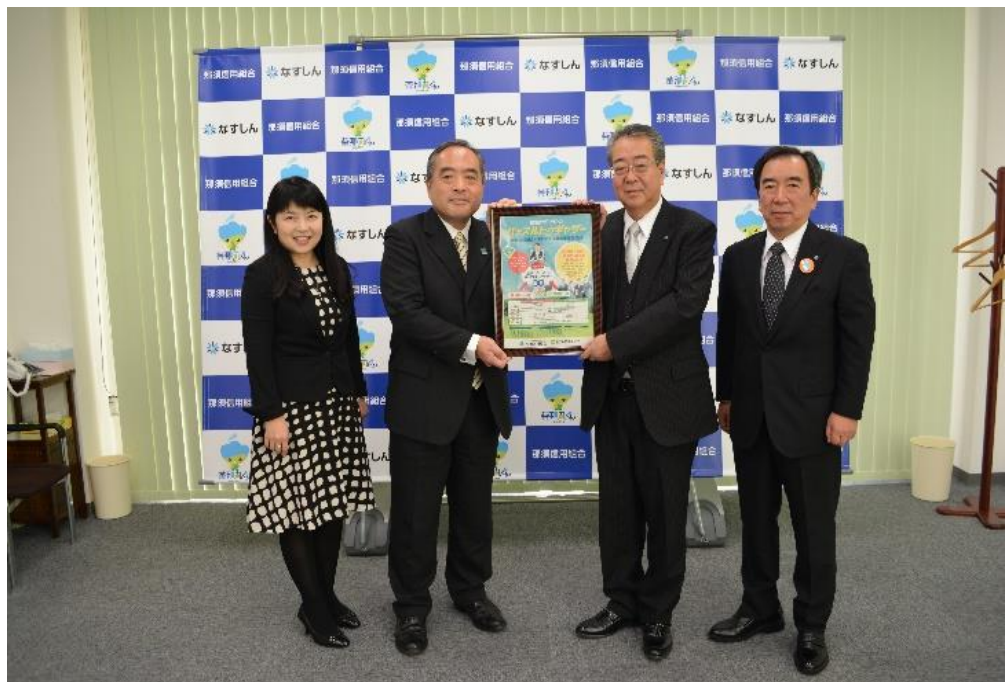
【2018年11月27日、日本政策金融との協調融資商品 「創業サポートローン・ハッスルトウギャザー」の取扱開始】

更に、中小企業の新たな事業活動の促進に関する法律に基づく経営革 新等支援機関として、取引先企業の各種補助金採択の支援を行なうこと や栃木県信用保証協会の「経営安定化支援事業」を積極的に取り組むこ とで経営改善支援を行なっております。その他、民間のコンサルタント 会社と提携を結び創業支援等の強化を図っております。