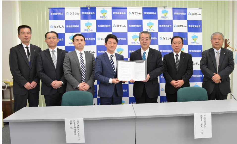
【平成 30 年 3 月 27 日 (株)アストラッドと業務提携】