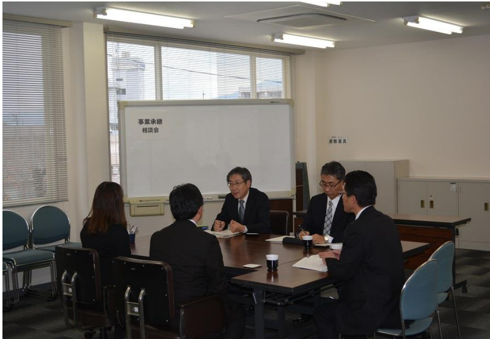
【平成 29 年 11 月 27 日 事業承継・M&A 相談会】