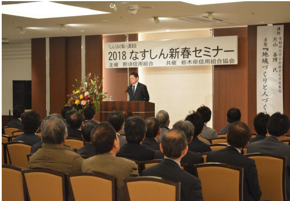
【平成30年2月7日 なすしん新春セミナー】