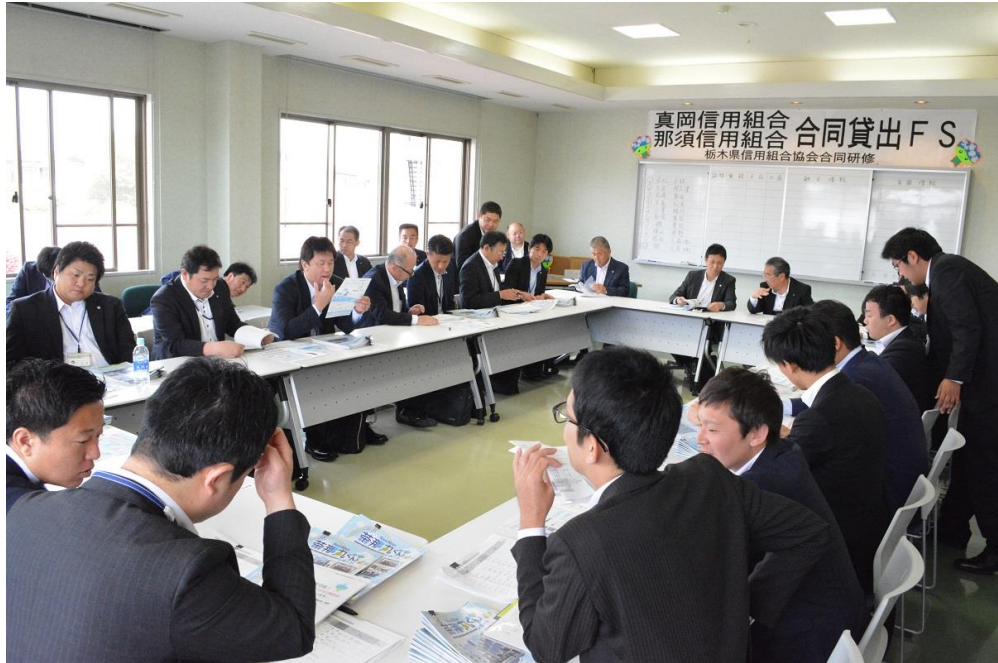
【平成 30 年 5 月 23 日 真岡信用組合と合同で実施した特別貸出 F S】