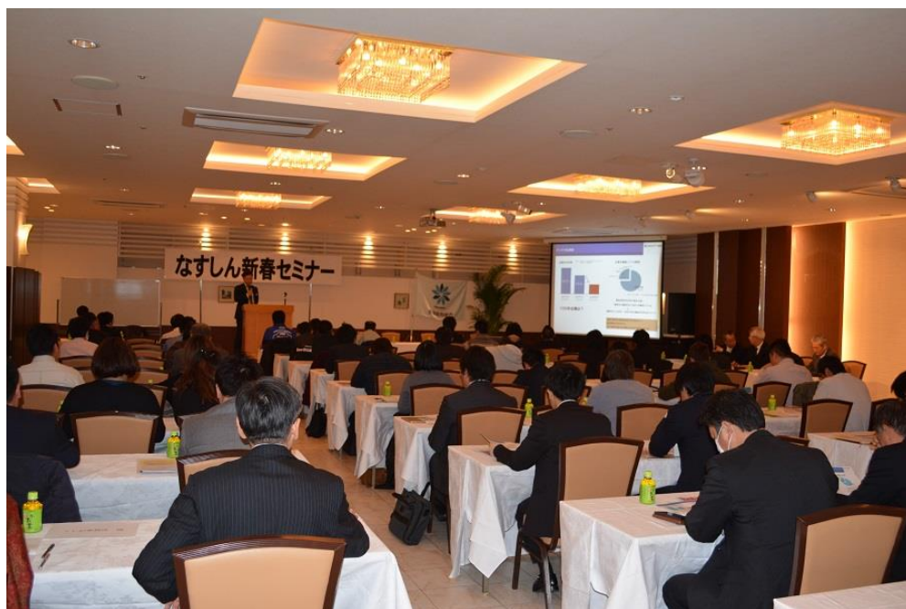
【平成29年2月3日 なすしん経営クラブ 新春セミナー】