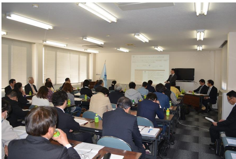
【平成 29 年 4 月 14 日 クラウドファンディング説明会】