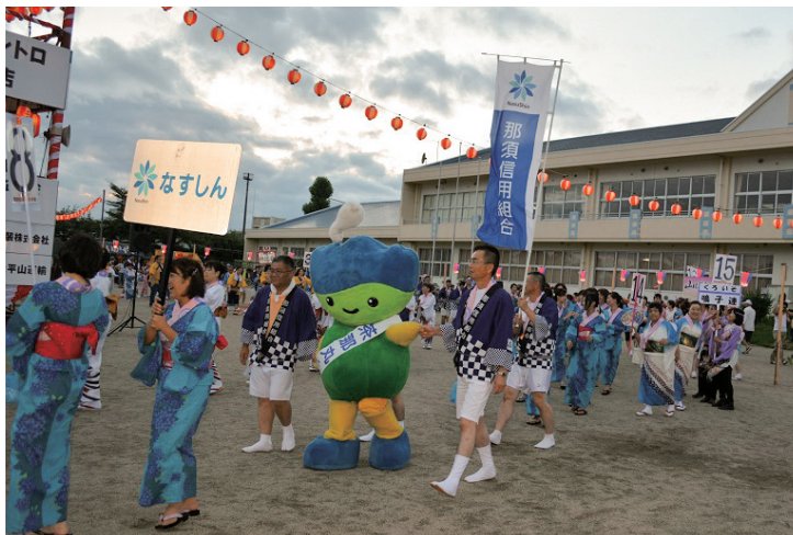
黒磯盆踊り 100回記念大会