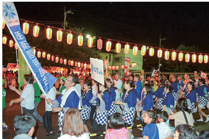
那須塩原駅前盆踊り