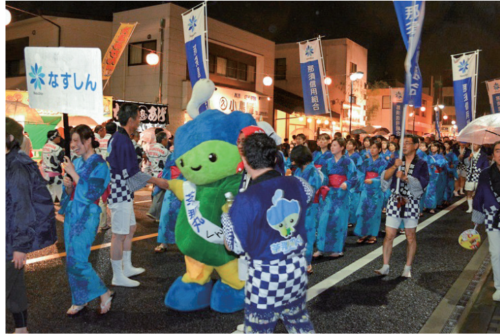
西那須野ふれあい祭り

平成29年7月29日に開催された「西那須野ふれあい祭り」、8月12日に開催された「黒磯盆踊り100回記念大会」、8月16日に開催された「那須塩原駅前盆踊り」等に参加し、地域の皆さまとの交流を深めるとともにお祭りを盛り上げました。